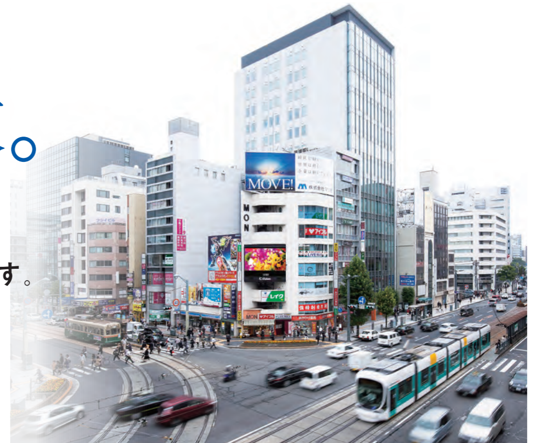
八丁堀交差点 (平成27年11月5日撮影)