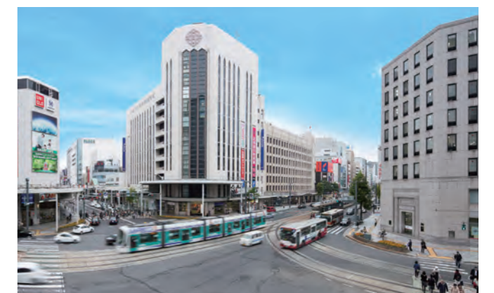
八丁堀交差点 (平成27年11月5日撮影)